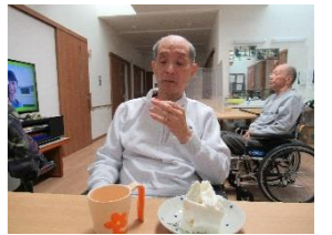
豪華なケーキ久しぶりだなあ～