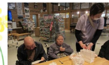
体力のある人は平泉まで足を延ばしました