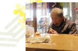
おやつは苑より持参した桜餅