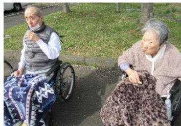
桜の下で持参したおやつをいただきました