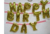
スタッフ渾身の飾り付け