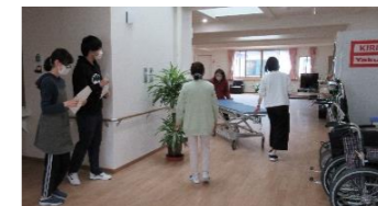
職員が少ない夜間帯、スムーズに搬送できるよう訓練しました