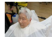
床屋が終わると笑顔です