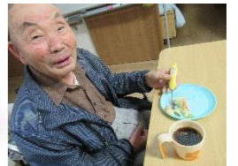
ユニットの皆さんにお振舞い！