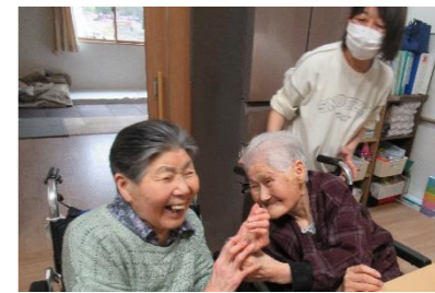
お二人ともステキです～の言葉にちょっとテレ気味