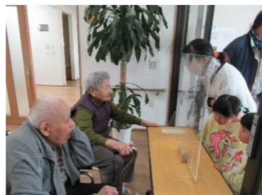
ちびっちゃん、中の様子に興味津々です