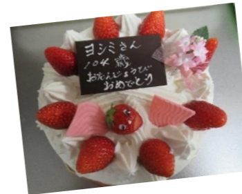
前日ご家族よりケーキが届きました