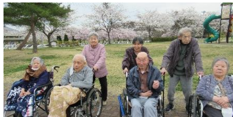
いちのせき遊水地公園