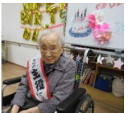
104歳おめでとうございます！