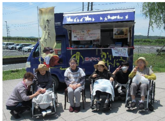
お土産買って、はいポーズ！