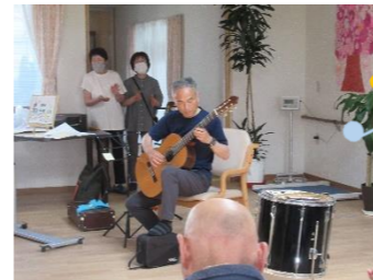
ギターにトランペットと多彩です

三味線：津軽じょんがら節 須川音頭、仙北荷方他 ギター：ズンドコ節、 青い山脈、カチューシャ他