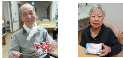
お土産は、かりんとう饅頭とアイス！