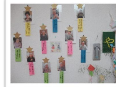
短冊に書いた皆さんの願い事 「熊の肉が食べたい！」の短冊にビックリ