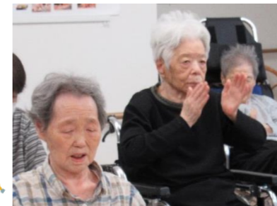
「♪あーおい山脈、雪わりざくらあ〜」