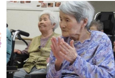
知っている曲を聴くと、皆さん手拍子！