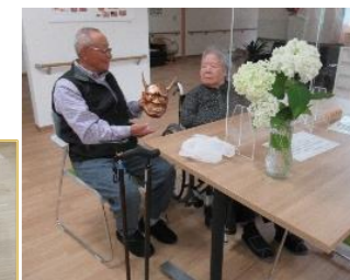
弟さんお手製の般若面!! 精巧な造りに思わずパシャリ📷