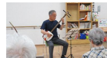
まずは、津軽三味線！ ボリュームがあり、すごい迫力でした