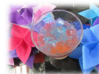
「あじさいゼリー」キレイにできました