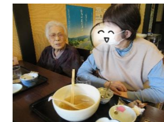
感想を聞くと、「来月もまた行きたい！」とのお返事。是非また(^_^)